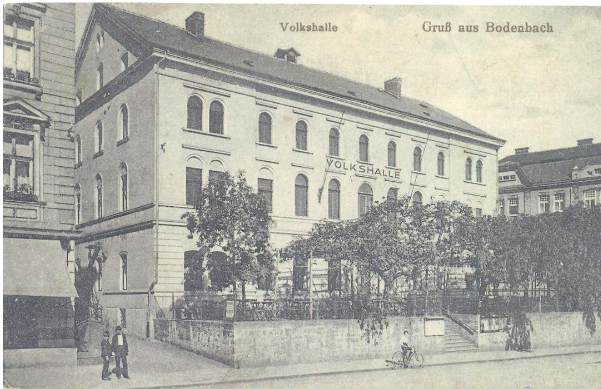
Před válkou Volkshalle- dnes ODPM (na teplické ul)